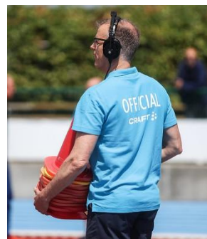
Frivillige til klubbens arrangementer er afgørende for klubbens succes.

En meget stor og oprigtig tak skal lyde til alle frivillige, der med deres uvurderlige indsats gør disse arrangementer mulige.