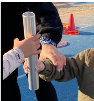
Sjov med atletik for de 3-5-årige var endnu engang en succes.

Breddeområdet har i 2025 vist en fortsat positiv udvikling og bidrager væsentligt til foreningens samlede aktivitet. Særligt har klubbens tilbud Sjov med atletik for de 3–5-årige igen i år været en stor succes med 121 deltagere fordelt på fire sæsonforløb .